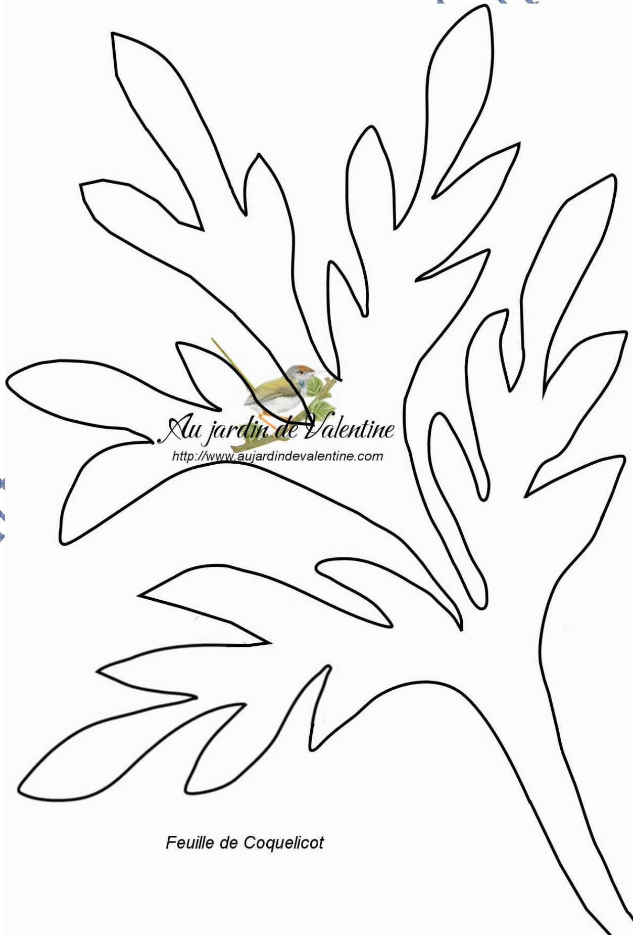
Feuille de Coquelicot